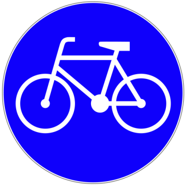
C-13 „droga dla rowerów”

Znak ten stosuje się celem wyeliminowania z drogi pojazdów innych niż rowery